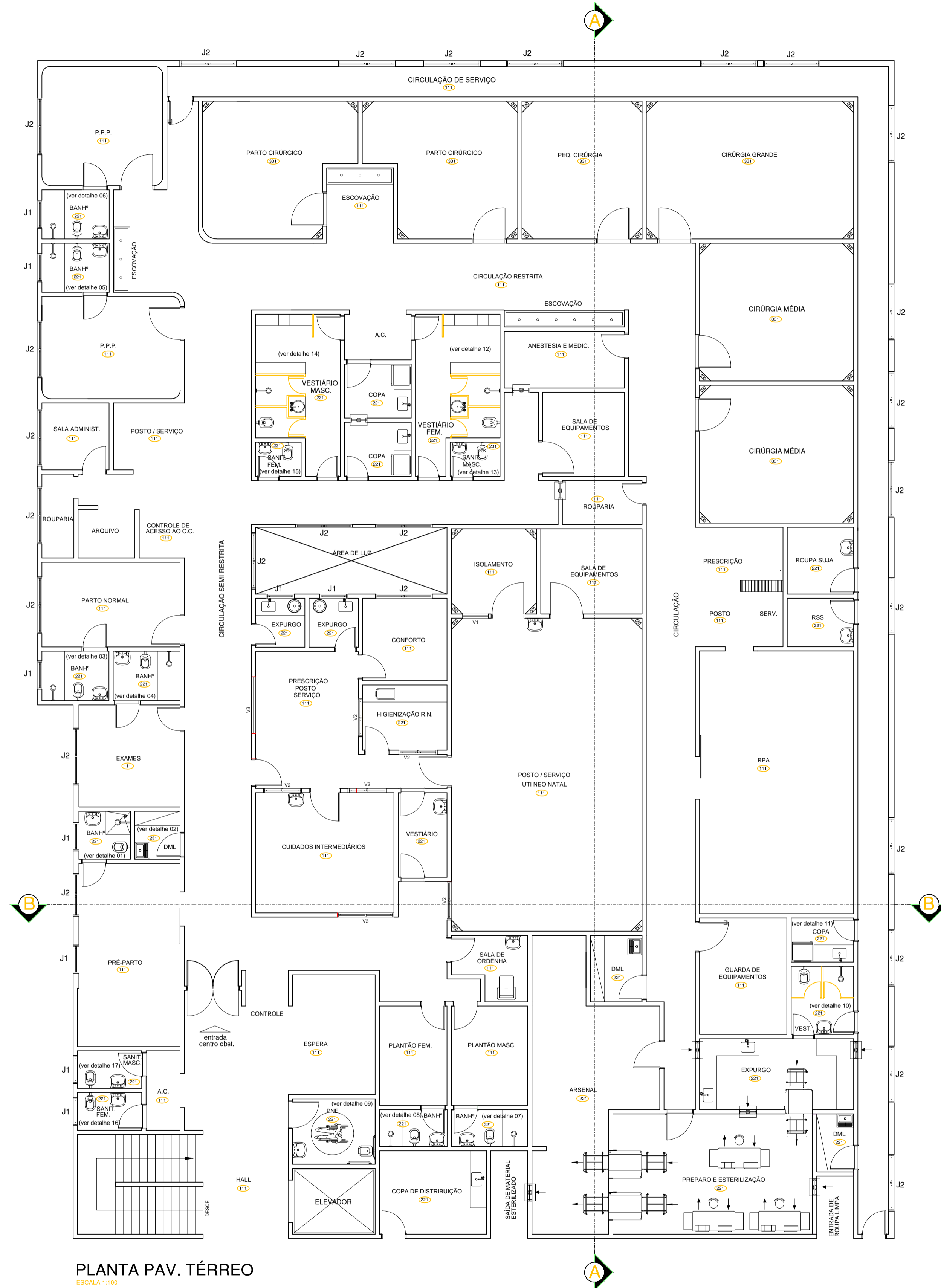
PLANTA PAV. TÉRREO